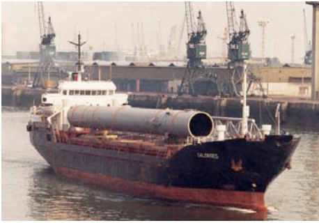
Les Navires d'autrefois : M/V Salorges