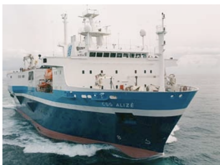
M/V CGG Alizé

http://www.arbitrage-maritime.org/fr/4_abonnement.php