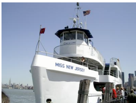
M/T Miss New Jersey