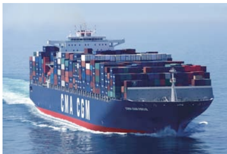
M/V CMA-CGM Fidelio