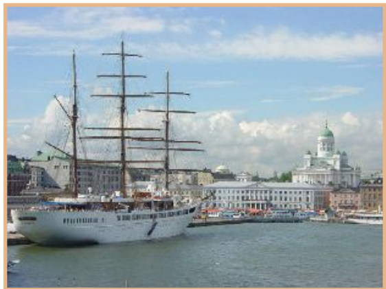
Paquebot «Sea Cloud II» à Helsinki

Pour télécharger les résumés des sentences en anglais, cliquez sur le lien ci-dessous : http://tinyurl.com/qd47m7