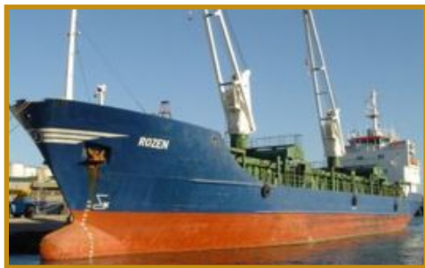
"MV Rozen" (Voir Web maritime p.9 - "Hijacking")

CA Paris, P1, ch 1, 2 avril 2013 N° 11-18244 : http://goo.gl/LWmxz