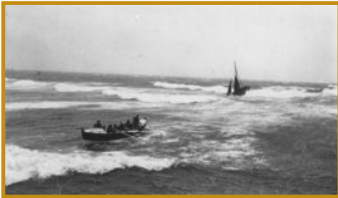
Sur la barre d'Audierne