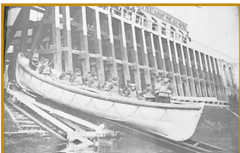
Mise à l'eau du canot à avirons de la Société Humaine et des Naufrages "La Providence" de la jetée Est de Boulogne.