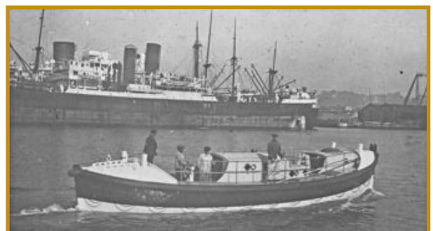
Canot de sauvetage insubmersible à moteur "Alexandre et Louise Darracq" en exercice vers 1934.

A voir la vidéo de 10' de Discovery Channel sur la construction du Triple E : http://goo.gl/P3Ntrg