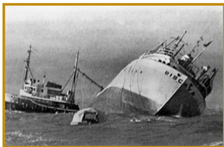
M/V Biscaya" en 1974