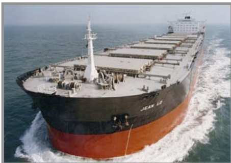
M/V Jean LD

http://www.arbitrage-maritime.org/fr/4_abonnement.php