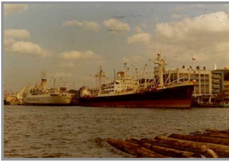
M/V Tobago Keelung (Taiwan) - Décembre 1973