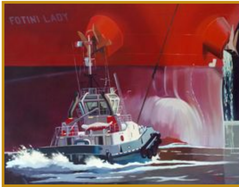
Remorqueur en manoeuvre 116 x 89

The Puerto Bruitago (1976) 1 Lloyd's Rep.250 – La situation était d'une extrême particularité : le navire avait été restitué dans un état de non "réparabilité juridique" car les réparations auraient coûté 2 millions de dollars (américains) et la valeur du navire, après réparations, n'aurait été que de 1 million de dollars. Lord Denning a jugé que le droit d'option n'avait pas lieu de s'appliquer à cette situation car le demandeur devait "in all reason" (le contraire eût été totalement déraisonnable ?) accepter la restitution du navire dès lors que l'octroi de dommages-intérêts constituait un remède adéquat quelle que soit la perte subie. Ce faisant, le critère de l'obligation d'accepter la restitution anticipée se compliquait singulièrement car trois notions entraient désormais en ligne de compte : celle d'intérêt légitime à poursuivre la continuation de l'affrètement, celle de dommages-intérêts constitutifs d'un "remède adéquat" et celle d'"attitude déraisonnable" à la refuser. La question a été reprise.