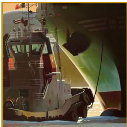
Bow to bow 100 x 100

© La loi du 17 décembre 1926 portant code disciplinaire et pénal de la marine marchande est rebaptisée en "loi relative à la répression en matière maritime", ce texte n'ayant plus de caractère disciplinaire et voyant son champ d'application étendu à d'autres secteurs que celui de la marine marchande.