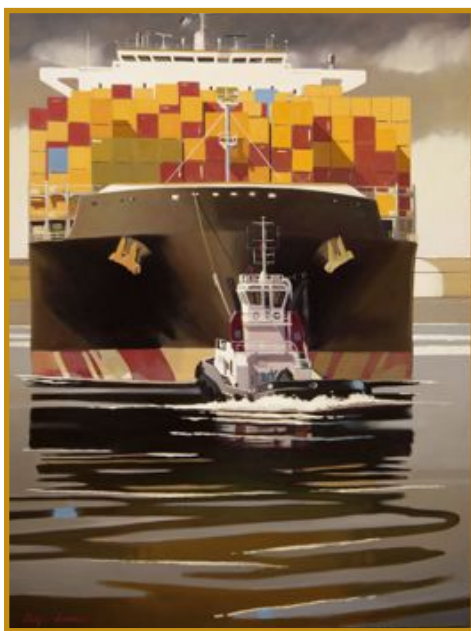
La touche bleue 97 x 130

La taille des navires imposera par exemple de respecter des hauteurs de marées si l'on veut permettre la mise à flot du navire à la période prévue au planning ou sortir le navire des formes de construction pour réaliser des essais en mer. De la même manière, le cadencement des livraisons sera effectué en tenant compte de l'intégration à bord des équipements. On n'attendra pas que la construction de la coque soit terminée pour intégrer les moteurs de propulsion. Il est donc impératif que le fabricant puisse les livrer de manière à ce que le chantier naval puisse les poser dans les premiers blocs du navire. Les contraintes seront les mêmes si le chantier naval a décidé de faire réaliser un sous-ensemble du navire dans un pays étranger. L'acheminement du ou des blocs pourra se faire par barge ou flottage et nécessitera que les conditions d'environnement