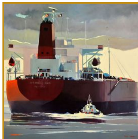
La relève du pilote 100 x 100

Pour s’abonner au résumé périodique des sentences, contacter le Secrétariat de la Chambre 16 rue Daunou - 75002 Paris, ou remplissez le formulaire à l’adresse : http://tinyurl.com/qon9ch