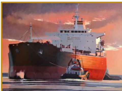
Manoeuvre au crépuscule 130 x 97

L'adresse du blog "Droit de la mer et des littoraux", animé par Jean-Paul Pancracio : http://blogs.univ-poitiers.fr/jp-pancracio/