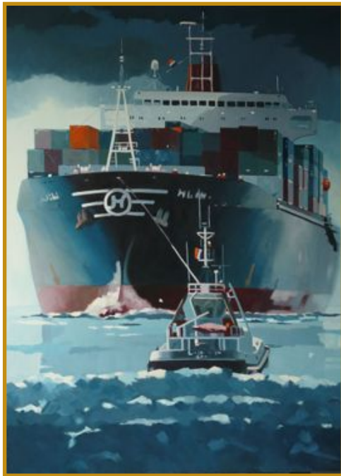
Lumières portuaires N°2 100 x 97