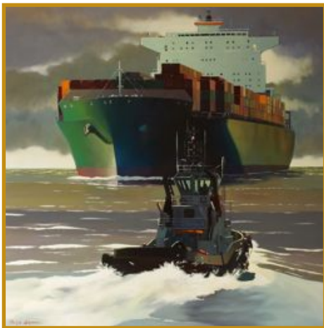
Lumières maritimes 100 x 100

Face au risque de piraterie, la mise en place de nouvelles formules de garanties principalement sur le marché de Londres entre les assureurs corps de navire, assureurs RC affrêteurs, assureurs facultés et assureurs va certainement développer des relations nouvelles entre ces assureurs. Les assureurs "Kidnap & Ransom" seront tentés d'effectuer des recours envers les assureurs maritimes bénéficiaires de la libération des biens par le paiement de la rançon, d'où une augmentation du risque jusqu'à présent non prise en compte pour ces assureurs.