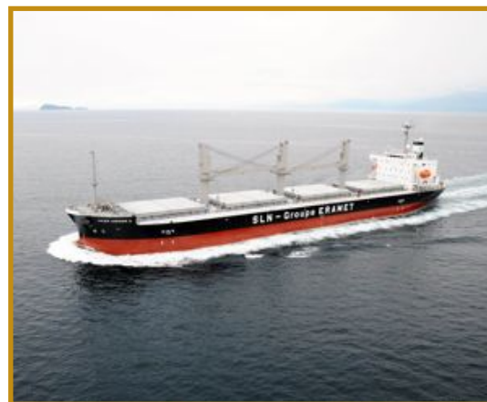
MV "Jules Garnier II"

Fruit d'une concertation poussée des différents acteurs impliqués dans l'exploitation et le transport du minerai de nickel, ce navire d'avant-garde, premier au monde à satisfaire aux dispositions de l'article 7.3.2.2 du Code IMSBC, participe à l'amélioration de la sécurité de la communauté maritime. Son coût, s'il est légèrement supérieur, reste cependant comparable à celui d'un navire classique de même taille. Ce surcoût est compensé par une durée d'affrètement plus longue, puisque ce navire, dont le volume des cales est nécessairement réduit et peu propice au transport d'autres marchandises volumineuses, est dédié au transport de minerai de nickel. L'utilisation plus répandue à terme de ce type de navire, spécialement construit, pourrait permettre de s'affranchir de toute une série de problèmes soulevés précédemment.