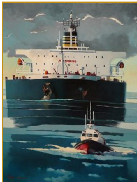
Lumières portuaires N°10 130 x 97