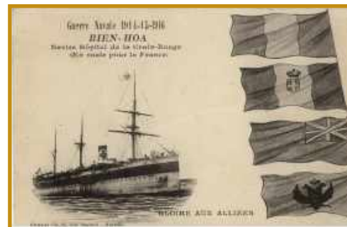
Navire transport-hôpital "Bien-Hoa" mis à flot le 6 octobre 1880.

Lors de sa fondation dans les derniers jours de 1894, la Société des Œuvres de Mer se donnait comme mission primordiale de porter des secours matériels, médicaux, moraux et religieux aux marins sans distinction de nationalité, et plus spécialement à ceux qui se livraient à la grande pêche. Pour atteindre ce but, elle armerait des navires-hôpitaux qui croiseraient aux époques convenables sur les lieux de pêches, bancs de Terre-Neuve et d'Islande. Un médecin et un aumônier seraient embarqués sur chacun d'eux.