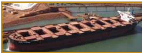
Le vraquier "Cape Falmingo" de 180 000 DWT en chargement à Port Hedland sur la côte nord de l'Australie- Occidentale (à 1 300 km de Perth).