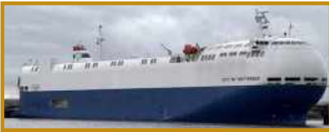
"City of Rotterdam" car-carrier de 2 000 voitures. Dimensions : 140m x 22m