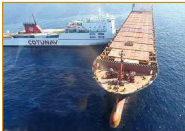
Abordage de "Ulysse" et "CSL Virginia" au large de la Corse

http://www.bea-mer.developpement-durable.gouv.fr/