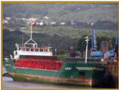
Illustration d'un navire NAABSA ("Not Always Afloat But Safely Aground") qui s'échoue à quai dans de petits ports de rivière. Une collection de photos de ces navires côtiers :