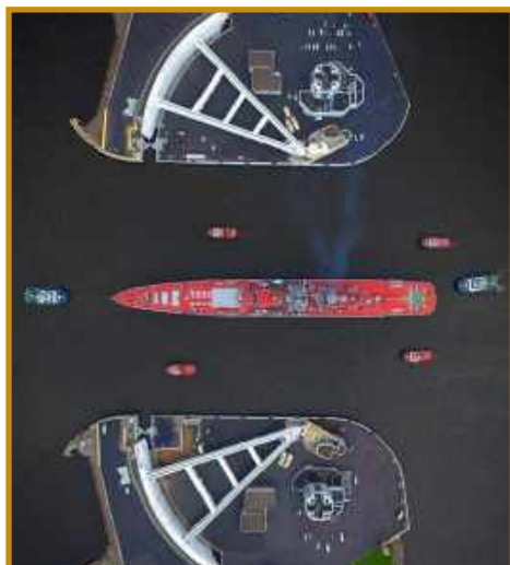
Vue aérienne d'un navire militaire, escorté par 6 remorqueurs, passant la barrière anti-inondation à l'entrée de Saint-Petersbourg.